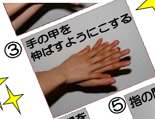
③ 手の甲を 伸ばすようにこする