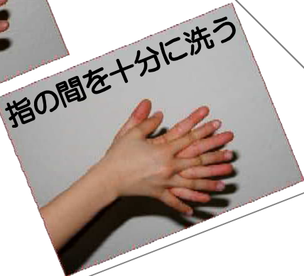
⑤ 指の間を十分に洗う