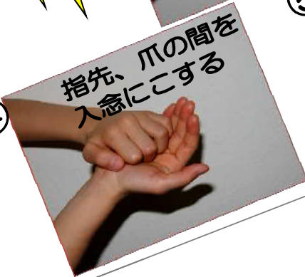
④ 指先、爪の間を 入念にこする