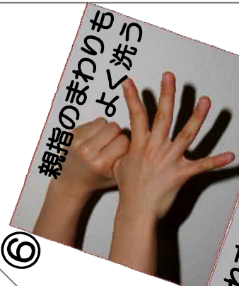
親指のまわりも よく洗う