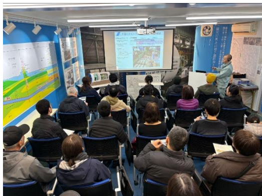
インフォメーションセンター内