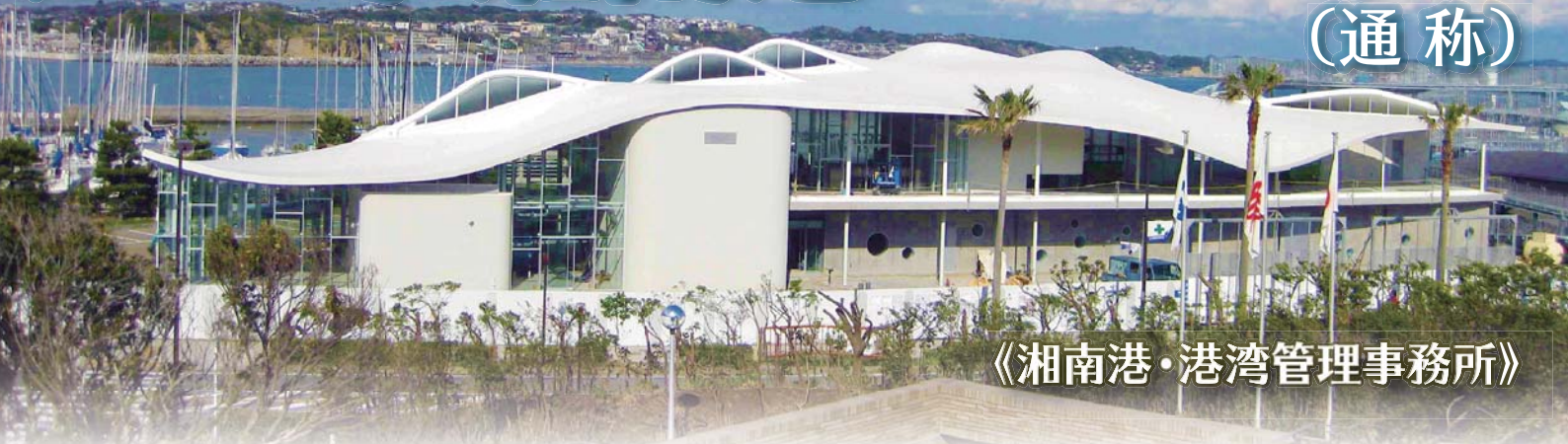
《湘南港・港湾管理事務所》

湘南港は、昭和39年に開催された東京オリンピックのヨット競技会場として整備され、以来、日本最大級の公共ヨットハーバーとして様々なヨット競技活動の普及、発展に貢献してきました。