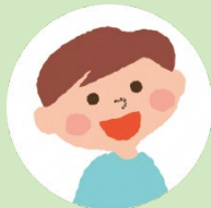
长子 Haruto 4 岁

开朗而温柔的妈妈。Mei 长到 1 岁的时候，将她送到保育园，重新开始工作，但每天却因育儿、家务和工作而疲于奔命，经常感到烦躁不安。