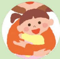
长女 Mei 1 岁

与 Haruto 上同一保育园的女孩。开始学说话，模仿 Haruto，摇摇晃晃地跟着后面的样子非常可爱。