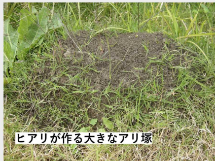
ヒアリが作る大きなアリ塚