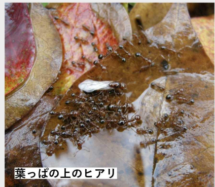
葉っぱ上のヒアリ