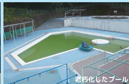
老朽化したプール