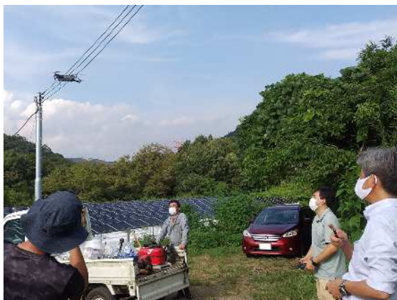
図 3-2 かながわ鳥獣被害対策支援センターによるドローンを活用した集落環境調査

地域による対策が非常に困難な場合や、対策の実施主体である市町村の実施体制（人員、予算）が十分でない場合、県は、計画の目標の達成状況等の実態に応じ、市町村と連携した対策の強化や支援等を検討する。