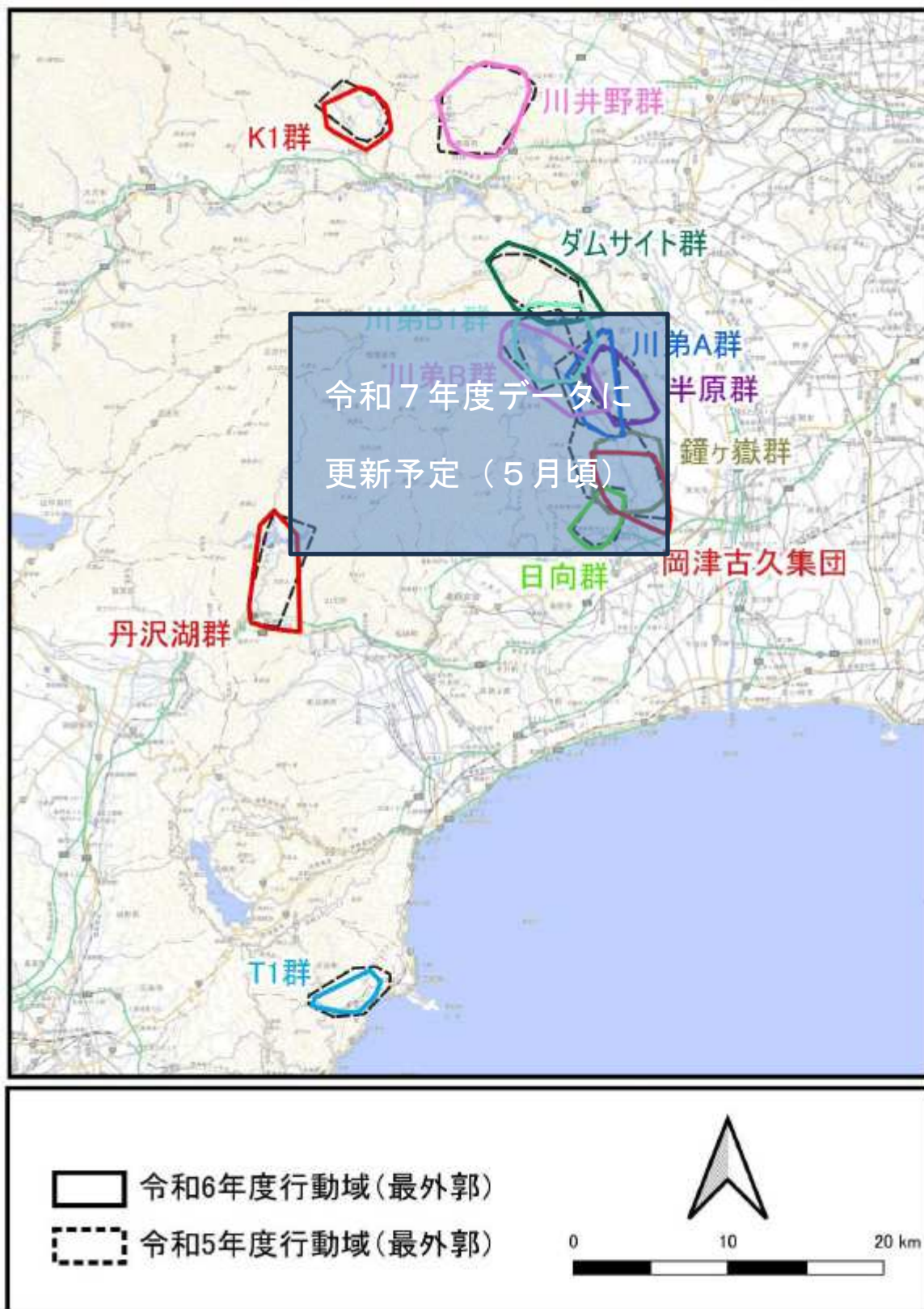
図1 各群れの行動域（令和6年度ニホンザル生息状況調査結果）