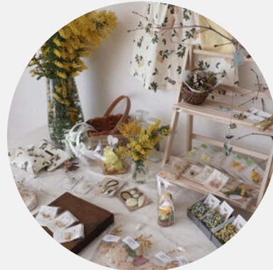
手づくり雑貨の展示販売♪