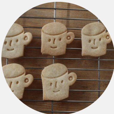
米粉のクッキーの販売 (卵・乳製品・小麦粉不使用)