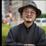
美術・空間構成 星野善晴