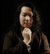
台本・演出 角直之