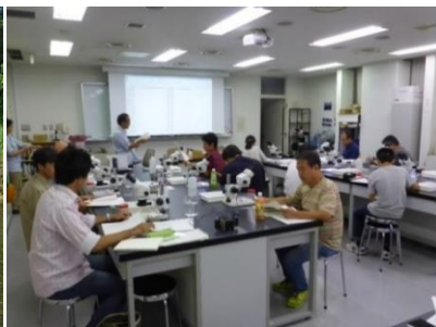
生物採集技術講習会の様子 生物同定技術講習会の様子