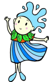
水源環境保全・再生 イメージキャラクター しずくちゃん