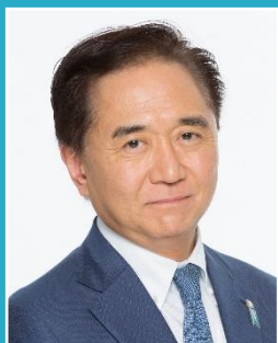
神奈川県知事 黒岩 祐治 (ビデオレター)