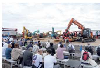
森林・林業・環境機械展示実演会