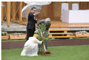
お手植え(全国植樹祭)

全国植樹祭で天皇皇后両陛下がお手植えされた樹木への皇族殿下によるお手入れや、式典行事などを通じて、 健全で活力のある森林を育て、次世代に引き継ぐこと の大切さを伝えます。