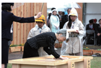
お手播き(全国植樹祭)