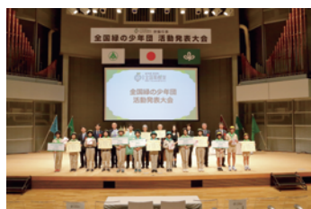
全国緑の少年団活動発表大会