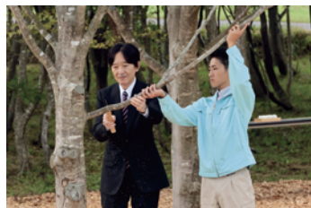
お手入れ行事(写真左:枝打ち、写真右:施肥)