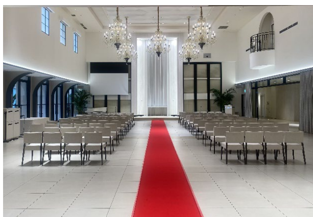
（会場１ スペース・コモンズ）