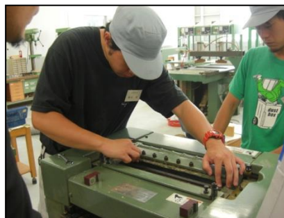
木工機械のメンテナンス