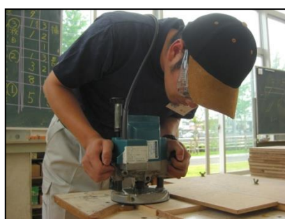
電動工具による加工