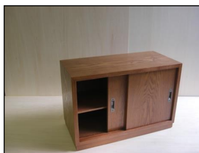
課題例 1(DVD ラック)