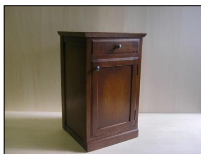
課題例 2(ベッドサイドボード)