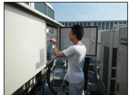
冷凍機・空調保守