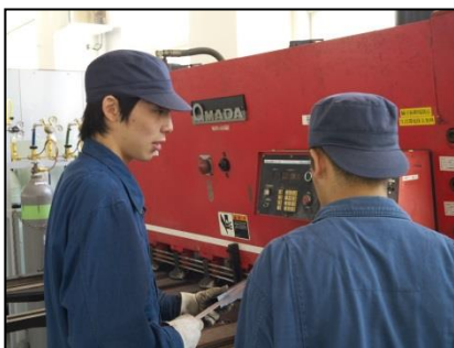
安全衛生 (機械取り扱い)