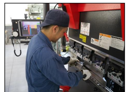
精密板金実習 (プレスブレーキ)