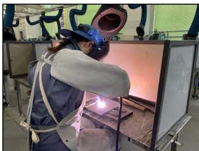
被覆アーク溶接実習