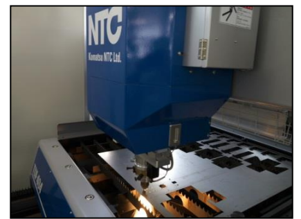
精密板金実習 (レーザ加工)