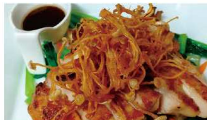
季節の野菜をトッピングした「チキンソテー」