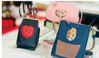
鎌倉彫のエンブレムと上質な革の融合が美しい一点物バッグです。

鶴岡八幡宮三の鳥居前に佇む特別な空間「鎌倉やしろ」。全国から選りすぐりの作家ものを多く置き、一点ものにこだわったオリジナリティ溢れるお店です。陶器、漆器やバッグ、アクセサリなど、それぞれに物語のある品々は、お客様に毎回新鮮で楽しめる空間をもたらします。古都鎌倉の季節を感じながらお気に入りを見つめられるように心を込めてご案内致します。