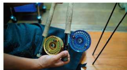
竿、リール、糸をはじめ、狙う魚に合わせた用具が手に入ります。フライ(毛針)の作り方もお伝えします。

豊富なフライフィッシング用品の品揃えで、お客様のご来店をお待ちしています。国内製はもちろん、フライフィッシングの本場・アメリカ・イギリスの用具も手に入ります。毎月開催しているスクールで知識や技を身につけ、大自然に飛び出しましょう!