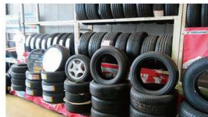
皆様の使用環境にあったベストのタイヤをご紹介します

当店は、1980年の創業以来、確かな技術をベースにきめ細やかなサービスと良心的な価格で、お客様のお車の足回りをサポートします。乗用車はもちろん、4tトラックや大型トレーラー、ミニカーやフォークリフトなどの特殊車両にも対応。大型車の方には「入りやすい広い敷地」として言われております。ご希望の性能や、お車の用途、車種、ご予算、納期等を考慮した上で、どのタイヤが一番おススメかをその都度ご提案させていただきます。