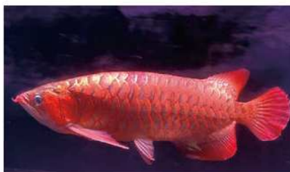
当店マスコット 60cmの「Big アロワナ」がお出迎えます!

初めて魚や小動物をお迎えする方も、心配なことがございましたらどうぞご相談ください。ふと疲れた目をやると、色とりどりの熱帯魚が泳ぐ水槽がある…そんな癒しの空間づくりを応援いたします。ドラマや映画など数々のメディア作品を依頼される確かな技術で、レストランや待合室、応接間や個室等にアクアリウムの楽しみと美しさのレンタルもいたしておりますので、お気軽にお声がけください。皆さまのご来店をお待ちしております。