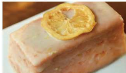
工房で手絞した国産レモンの風味をまるごと感じるレモンケーキ

店名の chercheuses (シェルシューズ) はフランス語で研究者という意味です。お客様をはじめとし、働くスタッフや農家さん、仕入れ先の業者さまなど関わる全ての人々を大切に作る店づくり、ものづくりに取り組んでおります。季節のフルーツや産地小麦、北海道産バター、栃木県産のブランド卵といった厳選した美味しい食材はよりおいしくなる加工を施し、心の栄養となるお菓子を日々研究しております。