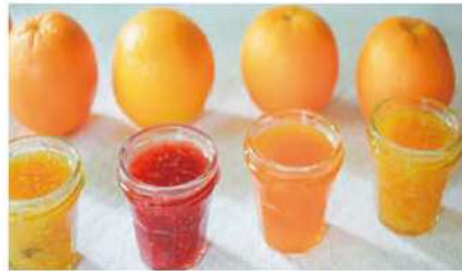
フランス菓子をベースにつくったジャムと焼き菓子

鎌倉で20年以上、暮らしになじむ手仕事の「ジャム」と「焼き菓子」を製造販売。30種以上のジャムや焼き菓子、紅茶やコーヒーが揃い、ギフトにも最適。パッケージまでこだわった、楽しいお買い物時間をご提供します。