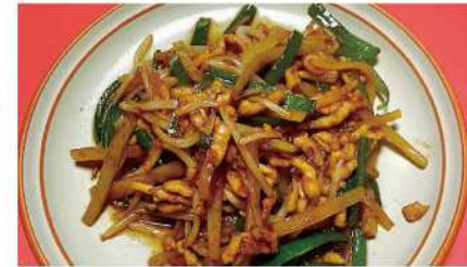
秦野ジビエを堪能！鹿肉の旨味凝縮、絶品青椒肉絲。

本場の味を大切にした本格中華を秦野市で気軽に楽しめる「チャイナガーデン」。豊富なメニューと上品な味付けの料理は、家族連れからお一人様まで大満足！落ち着いた店内で心もお腹も満たされるひとときを。