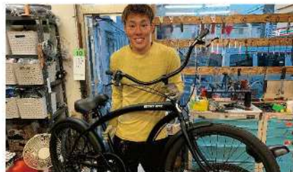
リサイクルのビーチフルーザーです！茅ヶ崎の道にぴったり！

「自転車の病院」をコンセプトに、地域に根差したお店を運営しています。3代にわたって築き上げたお客様との関係性とコミュニケーションを大切に、茅ヶ崎になくってはならないお店を目指しています。