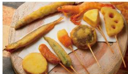
職人の技術、食材、調味料とこだわりが詰まった自信作です。

店内はカウンター席・テーブル席・座敷席を合わせて50席をご用意しており、地域の幅広い世代に親しまれています。串揚げは30種類以上とバリエーション豊かで、「リーズナブルで美味しい」と評判です。煮込み料理は3種類あり、いずれも6時間以上かけて丁寧に仕込んでいます。さらに、季節ごとの旬の食材を活かしたメニューも豊富に取り揃え、何度訪れても新しい味わいを楽しめるお店です。