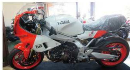
IXSR900 GP クラシカルな風貌と電子制御が融合。レトロスポーツの最高峰。

1963年の創業以来、二輪車の販売・整備を通じて、地域の安心・安全な暮らしを支えてきました。「暮らしの中に二輪車を」という想いのもと、お客様のニーズにしっかり応え、常に質の高いサービスを提供しています。国土交通省認定工場として、安全運転や環境への配慮にも力を入れ、地域とともに歩んでいます。