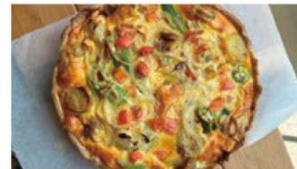
ソーセージと野菜たっぷりキッシュ

フランスで腕を磨いたシェフが、自家栽培の野菜を主に野菜をふんだんに使った仏家庭料理でおもてなします。名物の焼きたてキッシュは、野菜の旨味が凝縮された自慢の一品。心温まる料理とアットホームな雰囲気です。