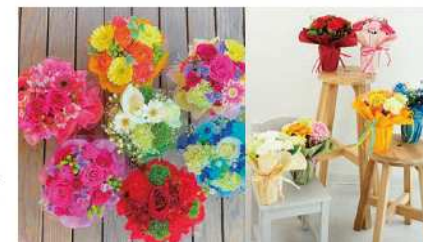
推しカラーのアレンジメントを贈ろう「ジェラートブーク」

お店には、「セルフフォトスタジオ」や三浦半島のお店が出店できる「POPUP ショップ用スペース」を併設。地域の皆様の温かい交流が生まれる店舗づくりを目指しています。ぜひ一度、足をお運びください。