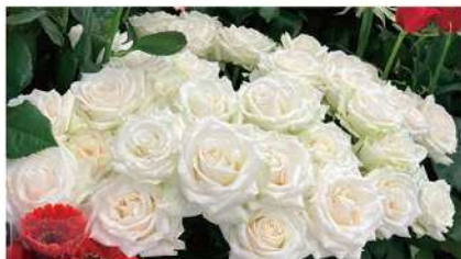
お客様のご要望をお伺いしながら、季節や場面に応じた最適な花をご提供します。

お祝い、感謝、励まし、そして別れ。花が必要とされるシーンは実にさまざまです。当店では、お客様一人ひとりの想いに寄り添い、その場にふさわしいお花を迅速かつ的確にご提案・ご用意いたします。急なご依頼にも柔軟に対応し、想いを最適なかたちで「花」に託してお届けします。お客様の大切な瞬間を彩るために、私たちは常に心を込めてお手伝いします。