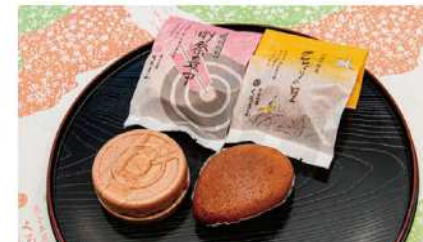
的祭典中、ひばりの里ほか、季節に合わせた創作和菓子販売。

ご贈答用からご自宅用まで、創作和菓子を提供する専門店。創業から約60年、地元で愛され続けてきた和菓子屋です。相模原や地元の祭りなどをモチーフとした産物菓子を10種類程度揃えており、季節を表現した上生菓子上に6種類提供、幅広い世代のお客様に好評です。また Instagram にて商品や店舗情報を積極的に発信しております。