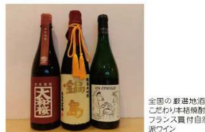
全国の厳選地酒、 こだわりの本格焼酎、 フランス産自然派ワイン

日本全国の美味しい地酒と本格焼酎、フランスの自然派ワインを中心に揃えております。直接蔵元に赴き、造り手の「人柄」「環境」「方法」を自分たちの目で見て、感じて、本当に美味しいと感じるものだけをセレクトし、お客様へご紹介しています。お酒の好きな方も、まだよくわからない!という方も是非お気軽にご来店ください。皆様の「わくわくする時間」をお手伝いできればと思います。