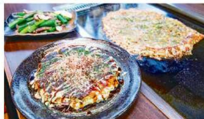
お好み焼34種類、もんじゃ焼16種類。お家で焼けるもんじゃも販売中。

地元はもちろん、関西や東京下町の方からも認められる老舗のお好み焼、もんじゃ焼店です。若者からお年寄りまでたくさんのお客様にご利用いただいております。また焼き方の分からないお客様には従業員がお手伝いいたしますので安心して召し上がれます。