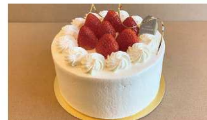
素材の良さを出し、ついもう一個食べたくなるケーキに仕立てています。

sweets WATANABE では「日常の楽しみとして、ちょっとした自分へのご褒美として気軽に利用できる店」「街のケーキ屋さんでありながらもすこしオシャレなお店」というコンセプトで様々なシーンで利用いただけるよう商品ラインナップや味、見た目も時代に合わせてアップデートしつつ変化も楽しんでもらえるお店として6年間人愛なくさんのお客様に支持をいただいております。