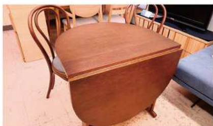
秋田で製造された、職人技が光るダイニングセットをご提供します。

ソファ、ベッド、カーテン…家具やインテリア選んでどうしたらいいんだろう？ そんな素朴な疑問にお応えしている町の家具店です。「家族の一員でもある家具・インテリアだからこそ、安心で安全にお使いいただけるモノでない」との想いで、お客様に「厳選された品質の良いモノ」をご案内いたします。