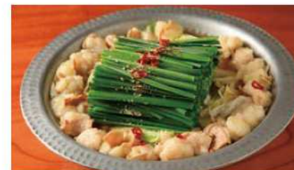
さかい目録の和牛もつ鍋

本厚木駅北口から徒歩3分。もつ鍋をはじめ、鳥鍋・豚しゃぶなど厳選素材を活かした鍋料理をご提供。日本酒・焼酎も有名無名問わず幅広く取り揃えています。和モダンな落ち着いた空間は、ご接待や特別なご集いにも最適。ゆったりとした時間をお過ごしください。