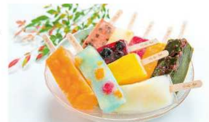
しゃりっもちっ! 冷凍で味わう新食感のモダン和菓子

1951年創業の和菓子店として、昔ながらの手作りの味を守りつつ、時代に合わせた新商品開発に挑戦しています。人気の「くずぱー」は市のふるさと納税返礼品にも採用され、全国配送を通して注目を集めています。SNSやLINEでの情報発信、当たり棒キャンペーンなど、世代を問わず楽しめる工夫を凝らし、日々地域とともに歩むお店づくりを目指しています。