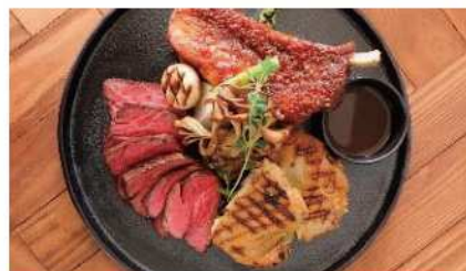
当店人気 No.1 の「牛gillステーキ」! 是非ご賞味あれ!

湘南のカフェなら484CAFE! 今もどなたかの「今日1番の感動」を生み出す場所であるようにと思いを込めて営業しております。