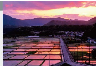
掲載イメージ ※カラーで掲載