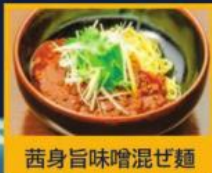
茜身旨味噌混ぜ麺

New discovery of Tuna, "Akanemi" Akanemi is a name for tuna's rich, dark red meat. Enjoy the rich and deep flavors and firm texture of Akanemi!