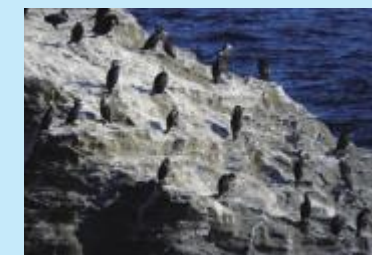
ウミウ Japanese Cormorant

Japanese Cormorants fly from the Kuril Islands every November, build a nest on the cliffs of the island and live there until April of the following year. The habitat of Japanese Cormorant is a natural monument designated by Kanagawa Prefecture.