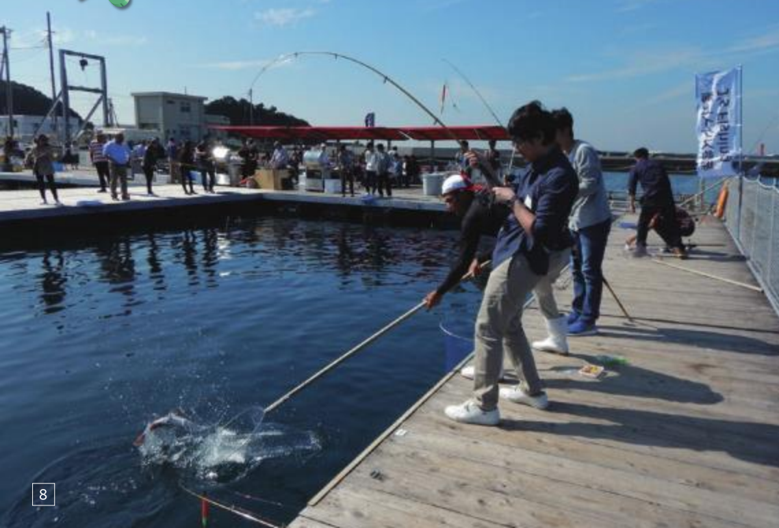
J'sフィッシング(海上イケス釣堀) J's Fishing (Fishing pond)

営業時間:9:00~16:00 定休日：火曜日 ※火曜日が祝日の場合は翌水曜日 料 金：4,950円~13,200円(利用時間などにより異なる) 問合せ：046-854-9891 Opening hours: 9:00 to 16:00 Regular closing day: Tuesdays *If Tuesday falls on a public holiday, the next Wednesday. Charges: ¥4,950 to ¥13,200 (depends on usage time) Tel: 046-854-9891