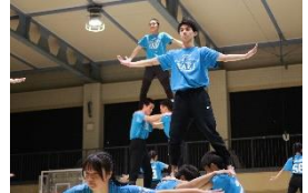
スポーツ科学科総合発表会