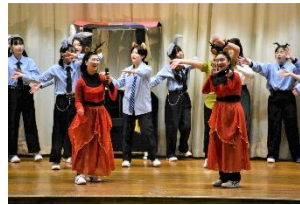
普通科発表会 表現活動