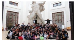
美術科姉妹校交流 イタリア