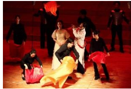
音楽科 校外演奏会