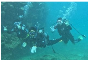
スポーツ科学科 水辺実習