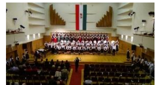
音楽科姉妹校交流 オーストラリア・ハンガリー