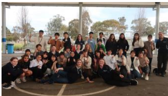
普通科姉妹校交流 オーストラリア