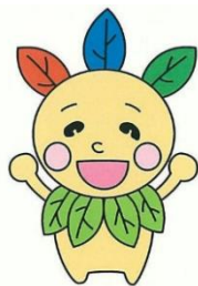
スクールキャラクター はしもん