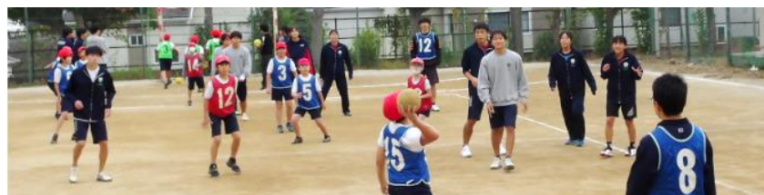
小学生と一緒にドッジボール！