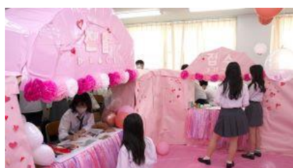
文化祭(模擬店の様子)