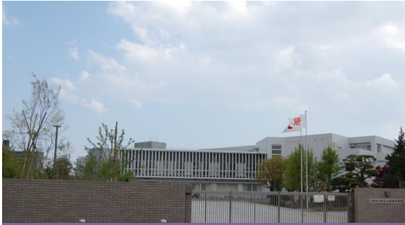
新校舎(平成27年3月完成)

所在地：相模原市中央区上溝6丁目5番1号 〒252-0243 電話：042(762)0008 FAX：042(762)5873 URL：https://www.pen-kanagawa.ed.jp/kamimizo-h/ 創立：明治44年4月 課程：全日制 設置学科・生徒数・学級数