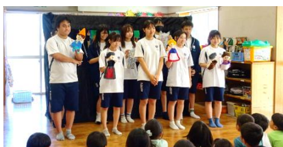
児童文化部の保育園訪問