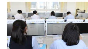
パソコンを使った授業