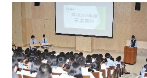
農ク全国大会の模様