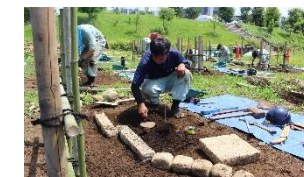
造園技能士検定の練習