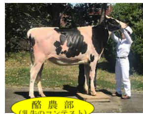
酪農部 (乳牛のコンテスト)