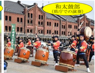
和太鼓部 (県庁での演奏)