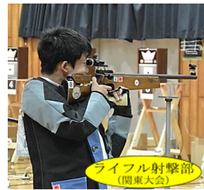
ライフル射撃部 (関東大会)