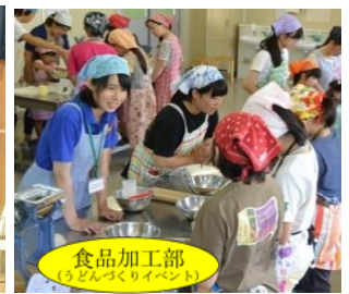
食品加工部 (ラドンづくりにイベント)