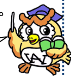
西高マスコット アウルくん

西高についてもっと知りたい人はぜひ本校の学校説明会にご参加ください。お待ちしております！