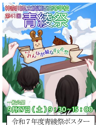
令和7年度青綾祭ポスター