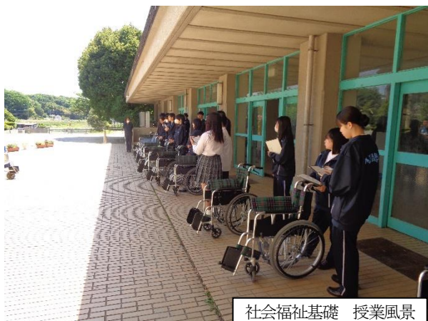
社会福祉基礎 授業風景

1年で「社会福祉基礎」、2年で「コミュニケーション技術」、3年で「介護総合演習」をそれぞれ週2時間、合わせて3科目を設置しています。1年では、福祉の基本的な知識を学ぶほか、手話、高齢者体験や車いす体験をします。2年では引き続き基本的な知識を学ぶほか、手話や点字、介護技術を学ぶ予定です。3年「介護総合演習」では今まで学んできたことをもとに、福祉施設等へ行って体験的な学習に取り組みます。