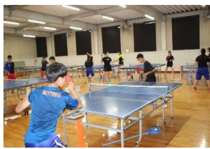
卓球 関東大会男子学校対抗 ベスト32(R6)