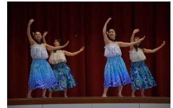
フラダンス 2025フラガールズ甲子園 総合3位(R7) 2024フラガールズ甲子園 総合2位 (R6)