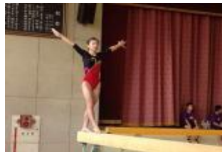
器械体操 第73回関東高等学校体操 競技大会 女子個人1名出場(R6)