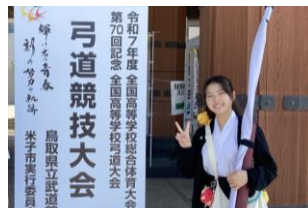
弓道 インターハイ出場 (女子個人・)(R7) 新人大会男子団体・個人4位(R4)