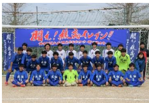
サッカー 新人戦 グループ1位(R7)