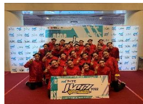
ダンス ダンススタジアム関東甲信越 大会出場(R5) 総合6位・朝日新聞社賞受賞(R元)