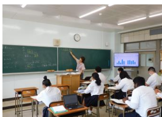
さいげんがいにくじんせいといと 在県外国人生徒のための 取り出し授業

大和南（やまなん）の生徒は、勉強に、 学校行事に、そして部活動に情熱を注ぎ、 高校生活を全力で過ごしています