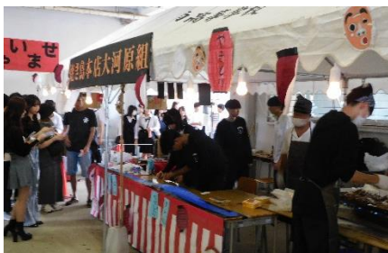
なんしやうさい 南翔祭（文化祭）