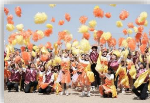
体育祭のダンス(令和7年度)