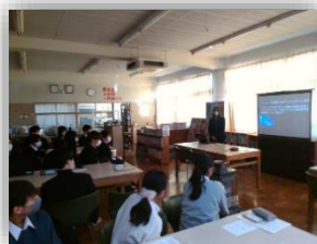
総合的な探究の時間 1・2年生合同発表会の様子

★「総合的な探究の時間」では、研究開発校として3年間をとおしてよりよい未来を切り拓くための課題解決力と行動力を育みます。