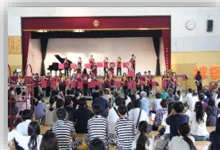
文化祭・ステージ発表(令和7年度)