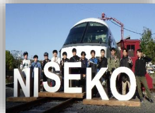
修学旅行(令和7年度 北海道方面)