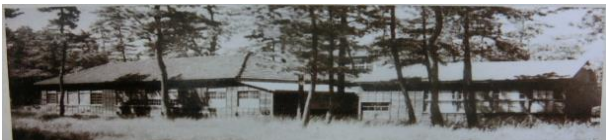
仮校舎全景(昭和32年)

平成28年度からは「プログラミング教育研究推進校」の指定を県より受け、新時代を切り拓くリーダーの育成に取り組んでいます。令和6年度からはDX加速化推進事業の採択校として、ICTを活用した探究的な学びを強化するために必要な環境整備を進めており、IT社会で活躍できる人材育成にも尽力しています。