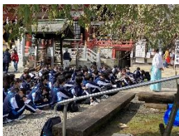
大山ウォーク(阿夫利神社)

○地域の福祉施設や特別支援学校、地域行事等でのボランティア活動や地元企業でのインターンシップを通して、生徒の社会性や地域へ貢献する心を育みます。