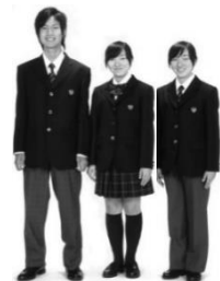
女子はスカートかズボン、リボンかネクタイが選べます。

本校は、生徒のみなさんが将来、社会から求められる規範意識や道徳観、誠実に物事に向き合う態度などを身に付けてほしいと考えています。本校で学ぶ中で、他者を思いやる気持ちや責任感を持ち、正しい判断ができる心豊かな人材や、周囲の人たちと良好なコミュニケーションをとりながら協力し合い、自分の力で人生を切り拓いていける人材に育ててほしいと願っています。