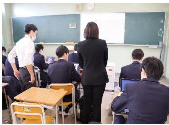
[英語コミュニケーション I]