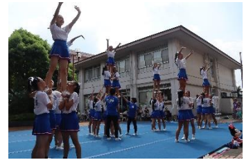
[チアリーディング部]