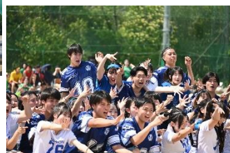
風音祭体育部門。演舞は必見！