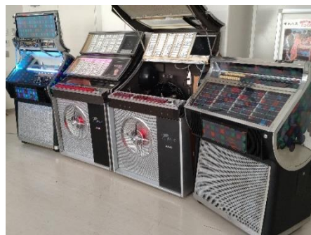
1960年製 ジュークボックス

本校は学校教育目標に学校を核とした地域づくりを掲げています。授業の中で地元企業と連携し、ジュークボックスの修理を行い、多摩区役所主催のイベントに参加や、生田緑地の立て看板製作など、工業高校の学習内容やその成果を地域の方々と共有し活かしています。