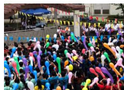
(文化祭オープニング)