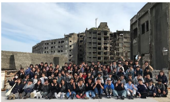
令和7年度修学旅行(長崎)