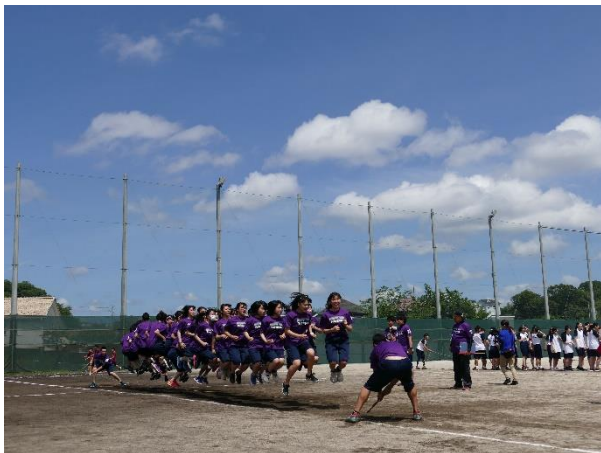
クラスの日(体育的行事)

過去3年間の進学先は、国立電気通信大学、広島大学、慶應義塾大学、早稲田大学、県立保健福祉大学、明治大学、青山学院大学、中央大学、法政大学、東洋大学、神奈川大学、日本大学、日本体育大学、昭和薬科大学、明治学院大学等と多岐にわたっています。進学方法も、総合型(AO)、学校推薦型選抜、一般入試と様々な受験方法で進学をしています。また将来の職業を見据え専門学校をめざす生徒や公務員試験に合格する生徒もいます。