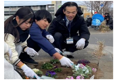
・フラワーロードプロジェクト