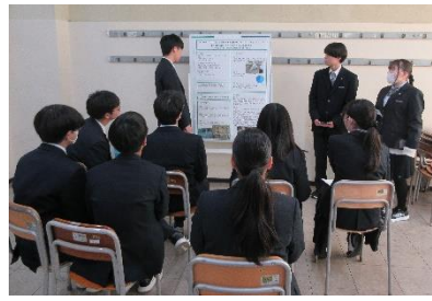
・探究成果発表会