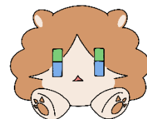
松陽マスコットキャラクター「まつりん」