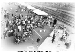
旭陵祭 野外特設ステージ

研修旅行や旭陵祭、陸上競技大会にレクリエーション大会など楽しい行事がたくさんあります。旭陵祭は、生徒が積極的に企画をした飲食店や展示など、個性的な催しが多くあります。屋外の特設ステージや体育館では、軽音楽部、ダンス部、さまざまな有志団体の演技披露など多彩なパフォーマンスで盛り上がります。