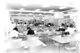
生徒でにぎわうラウンジ