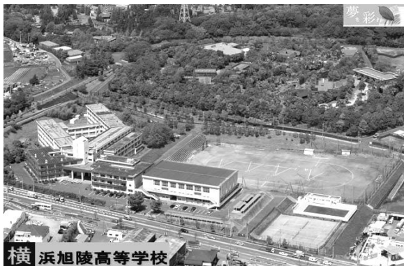
横浜旭陵高等学校