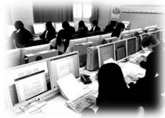
コンピュータは200台近く

情報の授業だけでなく、いろいろな科目でコンピュータや iPad、プロジェクター、DVDなどの視聴覚機器を利用して「わかる授業」「主体的に取り組む授業」を展開しています。生徒個人のスマートフォンやタブレットを学校の Wi-Fi に接続できるように環境を整えて、より ICT を活用した授業を行えるようになりました。 ※令和元年～4年度「ICT 利活用授業研究推進校」に県教育委員会から指定されています。