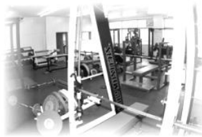
機器の整ったトレーニング室

卒業後、社会から求められる力は学力だけではありません。卒業後に必要となる考える力や表現する力などをつけるため、45分の2時間連続授業で、じっくり、しっかり、グループワークや発表なども取り入れた授業を行います。