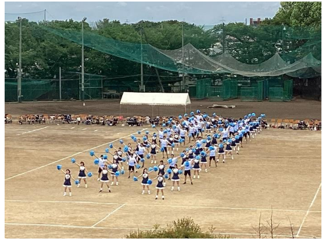
(伝統的な名物、応援合戦の演技)

文化祭は9月に実施し、模擬店・展示など、趣向を凝らした多様な企画を出しています。各種部活動の発表も好評を博しています。PTAも模擬店や物品販売などで積極的に参加しています。