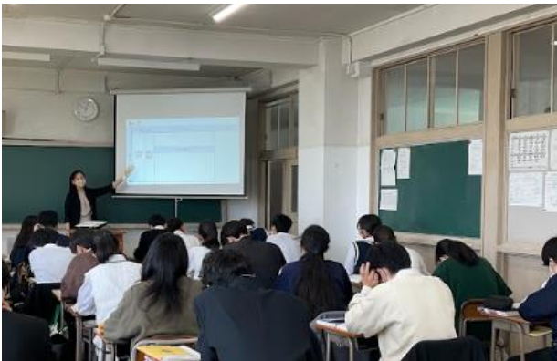
(ICT機器を活用した授業)