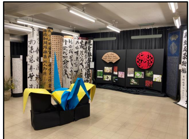
平和の祈り(書道部)