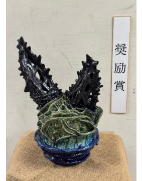
第72回神奈川県高等学校美術展 奨励賞受賞作品