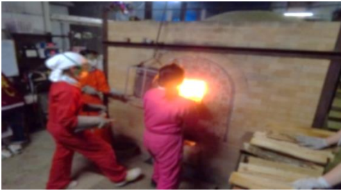
穴窯(あながま)による焼成