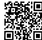
白山高校ホームページ