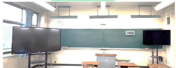
ユニバーサルデザインの教室環境