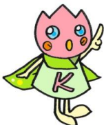
霧高のキャラクター「キリップ」です

霧高では、様々なことにチャレンジしながら未来を切り拓いていく生徒、自らの力で自己実現を果たしていく生徒を育てます。