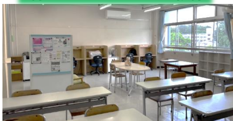
リソースルーム（3箇所あります）

霧高は『 インクルーシブ教育実践推進校 』です。共生社会の実現に向け、すべての生徒が共に学び、相互理解を深める「インクルーシブ教育」に取り組んでいます。