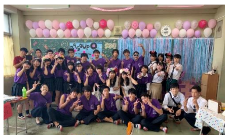
ひしょうさい 飛翔祭(文化祭)