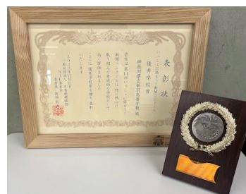
新聞コンクール表彰状と盾

授業を通じて校外での取組にも積極的に参加しています。第16回「いっしょに読もう!新聞コンクール」で3名が奨励賞を受賞し、さらに優秀学校賞も受賞しました。