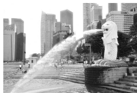
【修学旅行(シンガポール)】