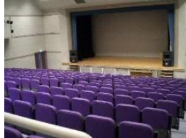
劇場イス・16チャンネル音響 設備・ビデオプロジェクター