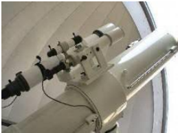
35cm 反射望遠鏡 (ドーム式)