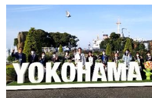
校内外留学生とウォーキング

みなと総合高校では、国際交流活動が盛んです。2024年度からのマレーシア現地校交流、オーストラリア・ターム留学への生徒派遣、2025年度からハワイ・オアフ島研修を実施しています。また、海外から年間留学生を受け入れています（開校から20か国以上）。生徒の自主性を重視し、担当のGEUとMateが企画・運営します。海外からの訪問校イベント、留学生との交流、年次を越えた意見交換イベントもあります。入学時の多文化理解プログラム、国際経験豊富なゲストによる講演会やフィールドワーク（横浜、東京、能登など）、校外へ出て英語で議論する横浜学生会議への参加、タイにある高校とのプレゼントボックス交換など活動は多彩です。