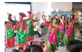
インドから来校の中高生と交流