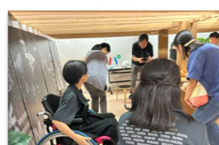
服飾系 ファッションショー